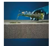
Säure- und chemikalienbeständig