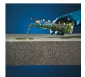
Haponkestävä / Kemikaalin-kestävä