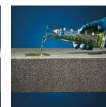
Resistente agli acidi