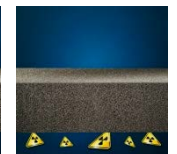
Apsauga nuo radono