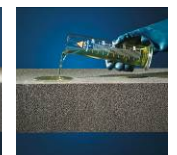
Atsparumas rūgštims/chemik alams