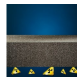
Protezione dal radon