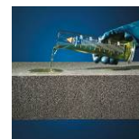
Resistente agli acidi