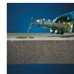
Resistente agli acidi