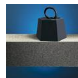
Resistente alla compressione