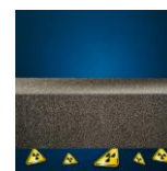
Protezione dal radon