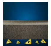
Bescherming tegen radon