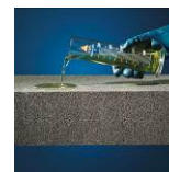
Syra- och kemikaliebeständigt