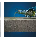
Resistente agli acidi