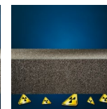
Protezione dal radon