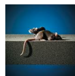
Resistente ai parassiti