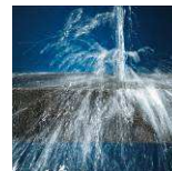
Étanche à l'eau