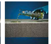
Résistant aux acides