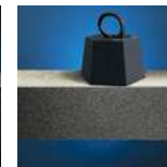
Résistant à la compression