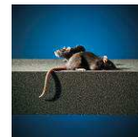
Résistant aux attaques