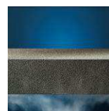
Étanche à la vapeur d'eau