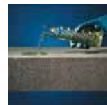
Kwasoodporne / odporne chemicznie