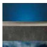
Nieprzepuszczalne dla pary wodnej