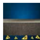
Ochrona przed radonem