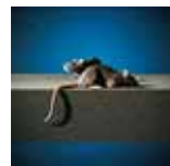
Odporne na szkodniki