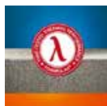
Termoizolacyjność niezmienna w czasie