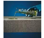
Haponkestävä / Kemikaalinkestävä