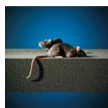
Resistent mod skadedyr