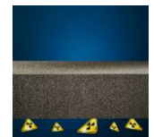
Beskyttelse mod radon