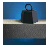
Wysoka wytrzymałość na ściskanie