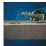
Kwasoodporne / odporne chemicznie