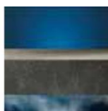
Nieprzepuszczalne dla pary wodnej