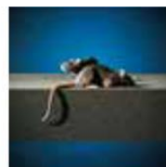
Odporne na szkodniki