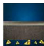
Ochrona przed radonem