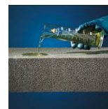
Syra- och kemikaliebeständigt