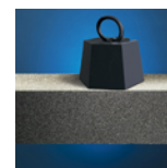
Resistente alla compressione