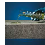
Resistente agli acidi