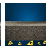
Protezione dal radon