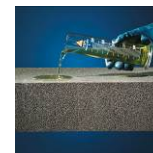
Resistente agli acidi