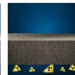
Protezione dal radon