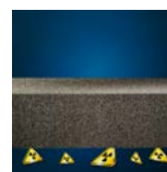
Bescherming tegen radon