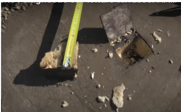
3: Prendre le mètre et mesurer l'épaisseur de l'isolation