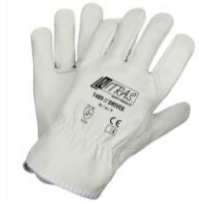
Gants en cuir