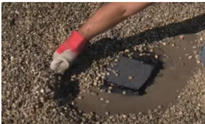
7:Remettre les graviers en place