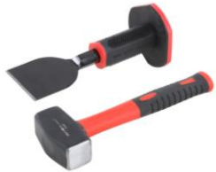
ciseau de maçon & marteau