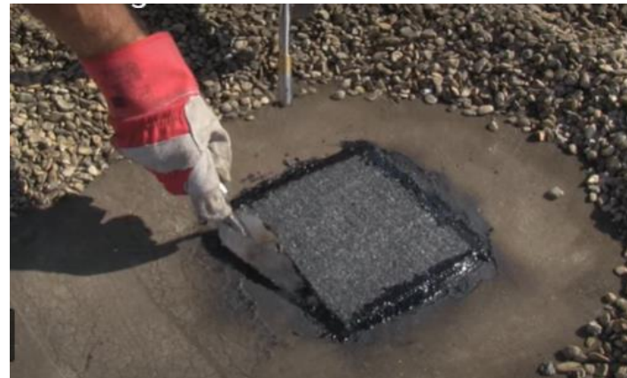
6:A l'aide du chalumeau à gaz et de la langue de chat refermer le sondage