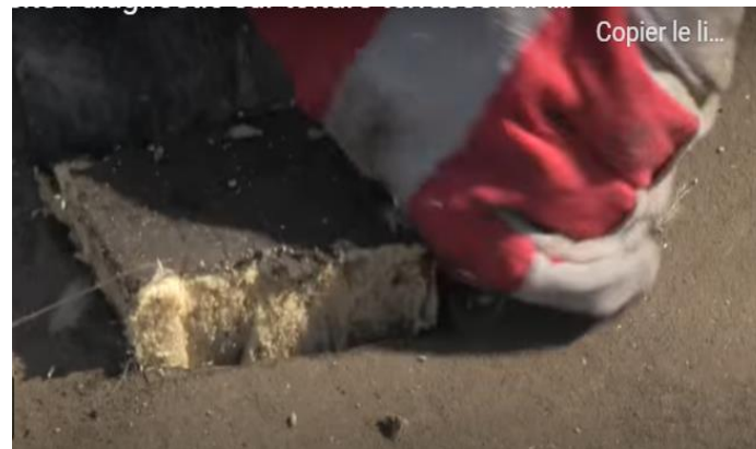
2: Enlever l'isolation existante