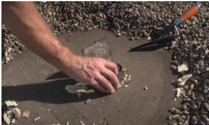
5:Replacer l'isolation à l'intérieur