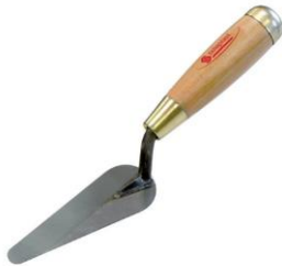
truelle langue de chat