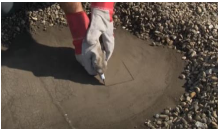
1: A l'aide du cutter, couper l'étanchéité