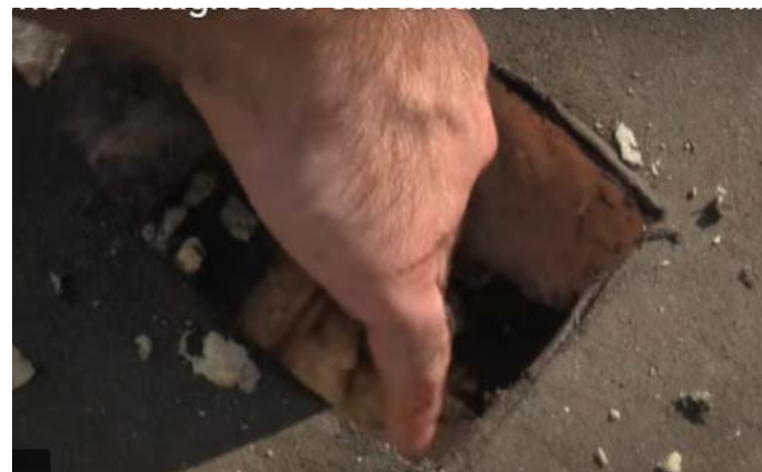
4: Vérifier si il y a pas d'eau à l'intérieur