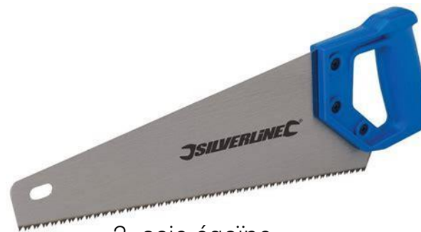
2- scie égoïne