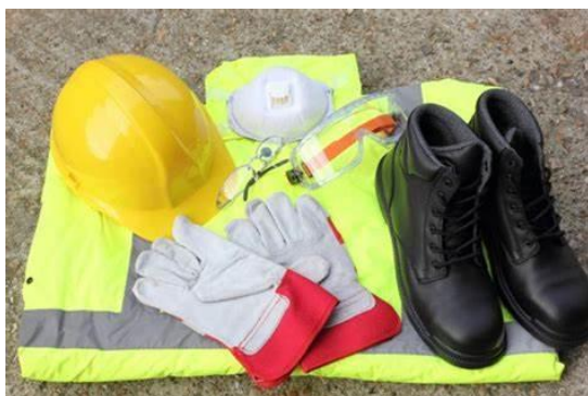
3 - Equipement de protection individuel