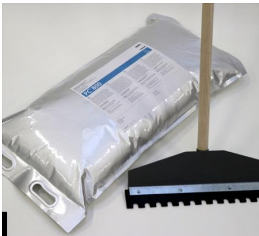
1- Raclette caoutchouc crantée