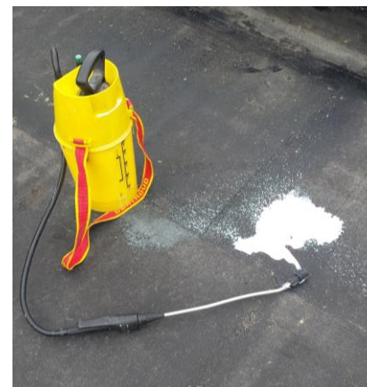
4 - pulvérisateur